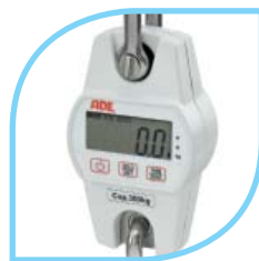
Peson non Classe III Réf. SR 282 0400