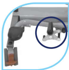
Système blocage des longons en position ouverte Réf. SR 287 0100