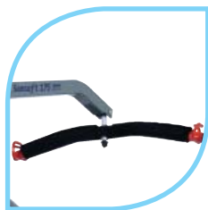
Palonnier cintré 2 points amplitude de levage de 177 cm Réf. SR 285 1200