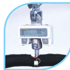
Peson Classe III Réf. SR 282 0500