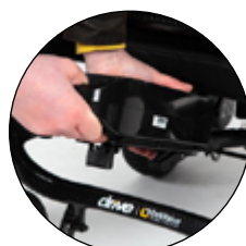
Batterie Lithium 20 Ah pour plus d'autonomie