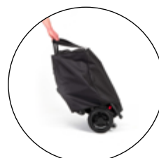
Housse de rangement et de transport