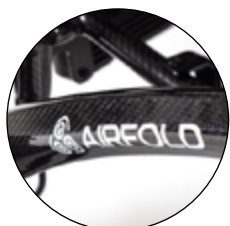
Châssis en fibre de carbone