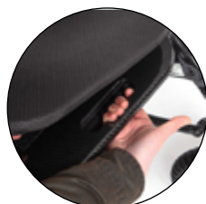
Poignée de transport sous l'assise