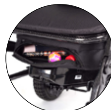
Rangement sous l'assise