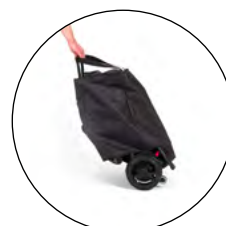
Housse de rangement et de transport