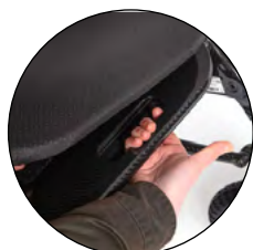
Poignée de transport sous l'assise