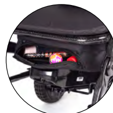
Rangement sous l'assise