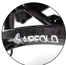
Châssis en fibre de carbone