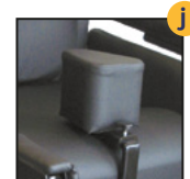
Plot d'abduction escamotable*