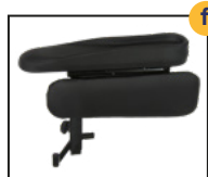
Manchette gouttière mousse visco, réglable et orientable*