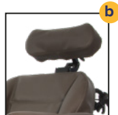
Revêtement Aspect cuir (PVC)