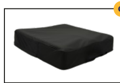
Coussin prévention de l'escarre visco-élastique classe II