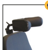
Appui-tête à oreillettes longues et orientables*