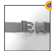
Ceinture de sécurité ventrale