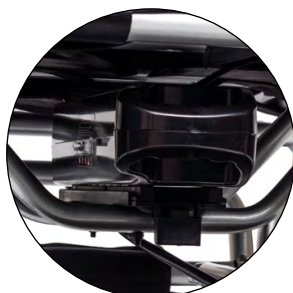
Batterie supplémentaire disponible pour encore plus d'autonomie