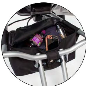
Sacoche de rangement