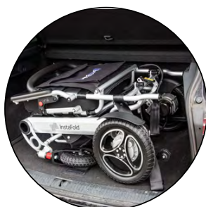
Se range facilement dans un coffre