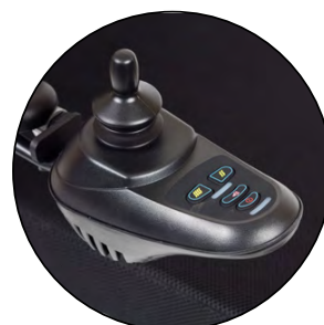
Contrôleur joystick intelligent